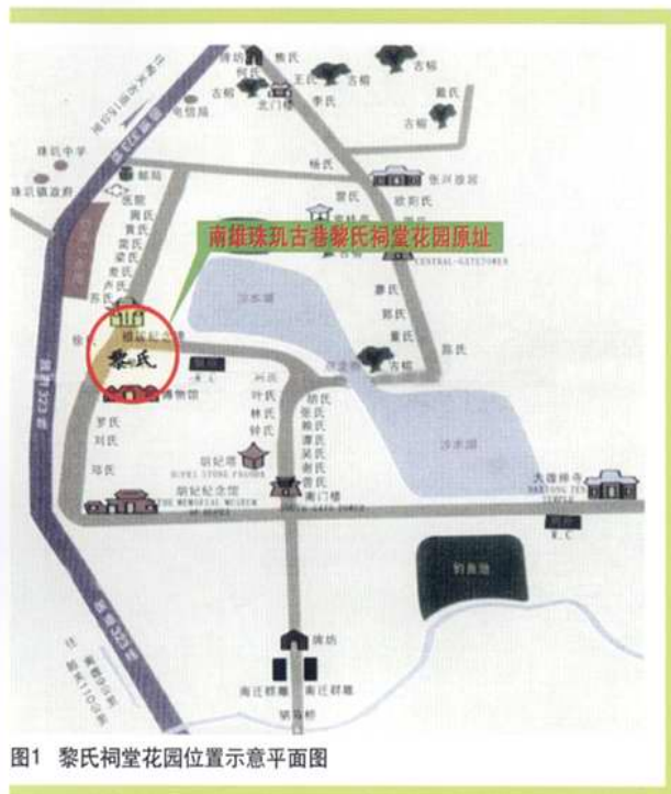
图1 黎氏祠堂花园位置示意平面图

“黄花遍地缀珠玑,广府人称为故居”。粤北珠玑古巷,是韶关南雄境内颇负盛名的珠江三角洲一带主要族姓的祖居发源地,黎氏是其中之一姓。开发珠玑,旨在“溯源兴邦,凝聚中华”,其意义已远远超出旅游观光范畴。据此,珠玑古巷黎氏祠堂的园林规划设计,要赋予更多的“慎终追远”、“根系珠玑”的文化内涵,并融入珠玑古巷小区总体规划,彰显出珠玑后人怀念先辈、寻根桑梓的殷殷亲情。