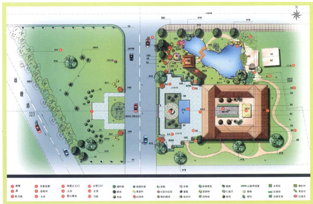
图2 黎氏祠堂花园总平面图

设范围,总占地面积约为4000 m 2 ,主体建筑为425 m 2 ,其余为花园用地(见图2)。